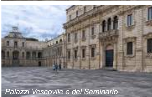
Palazzi Vescovile e del Seminario