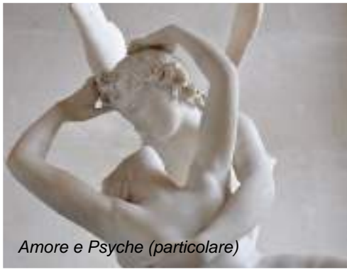
Amore e Psyche (particolare)

casa dove, oltre agli ambienti della quotidianità, si possono conoscere i materiali, le tecniche