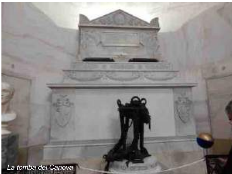
La tomba del Canova

done del Tempio, che porta direttamente di fronte alla casa che fu proprio del Canova. Se si vogliono provare emozioni forti non deve mancare una visita guidata alla Museo che comprende la casa dove è nato e vissuto lo scultore e la spettacolare quanto emozionante Gypsotheca. Guide esperte vi condurranno tra le stanze della