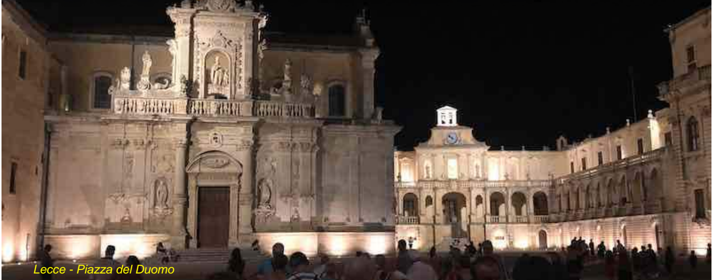
Lecce - Piazza del Duomo

È il Salento una delle località più gettonate dal turismo in genere e quello in particolare praticato con il camper. Da qualche anno a questa parte ciò avviene anche per i raduni di Capodanno.