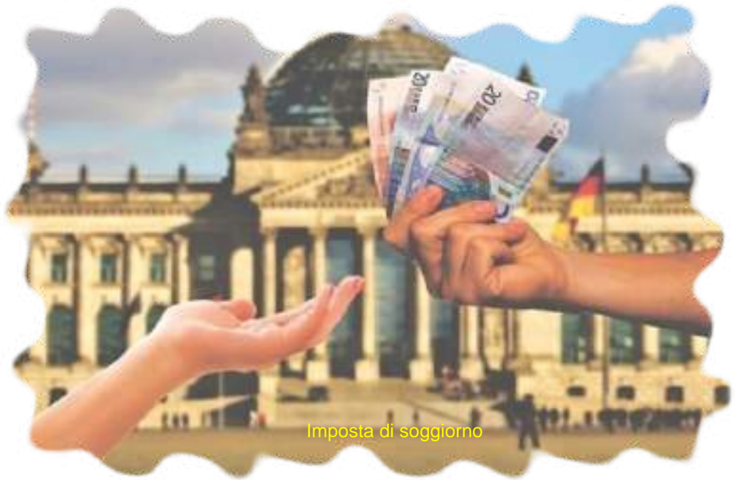
Imposta di soggiorno