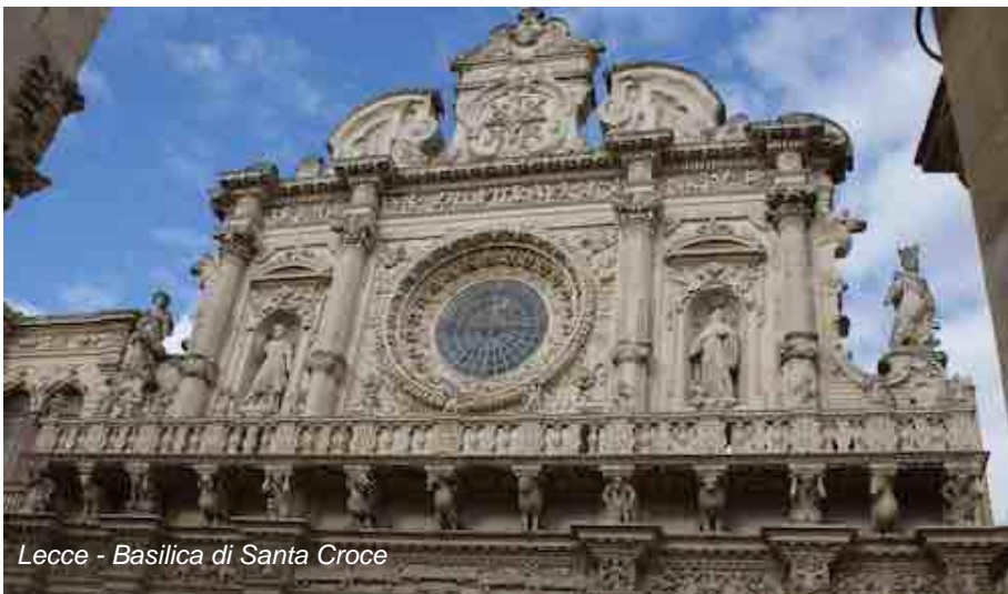
Lecce - Basilica di Santa Croce